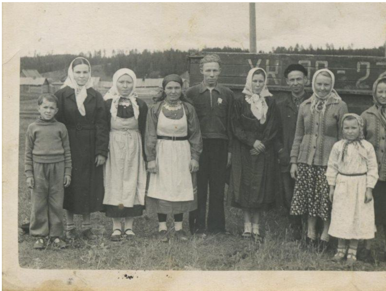
Жители д. Елово (из личных фондов)