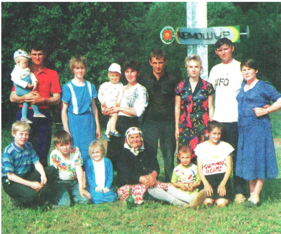
На месте исчезнувшей д. Чемошур. 1996 г