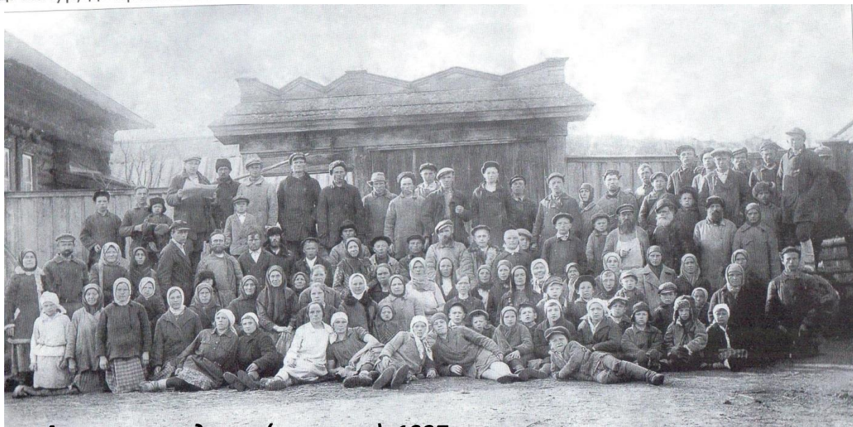
Жители Игринского починка у Агаповского двора (контора). 1937 г. (архивный отдел Администрации Малопургинского района, Ф.210. Оп.1. Д.42)

Фото из книги «Бьют родники серебром на земле предков» Составитель: А. И. Вологжанина