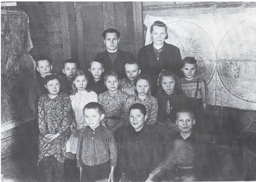
Дети войны с. Игринское, д. Кечур, д. Прокошево.

Фото из книги «Бьют родники серебром на земле предков» Составитель: А. И. Вологжанина